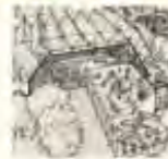
Arbejde og fritid

Det teknologiske samfund kan forstås som et samfund, hvor teknologien er en central del af livet. Det betyder, at teknologien er en del af vores identitet og vores måde at leve på. Det betyder også, at teknologien er en del af vores økonomi og vores politik. Det betyder, at teknologien er en del af vores kultur og vores værdier. Det betyder, at teknologien er en del af vores fremtid.