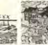
Bolig og produktion

Ressourcer og energi er vigtige for vores liv. Vi har brug for energi til at drive vores teknologier og vores økonomi. Vi har brug for ressourcer til at producere energi og til at leve vores liv.