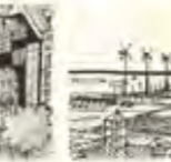
Ressourcer og energi

Nye støjhuse er et problem, der rammer mange mennesker. Støj kan påvirke vores sundhed og vores livskvalitet. Det er vigtigt at være opmærksom på støjniveauet i vores bolig og i vores omgivelser.